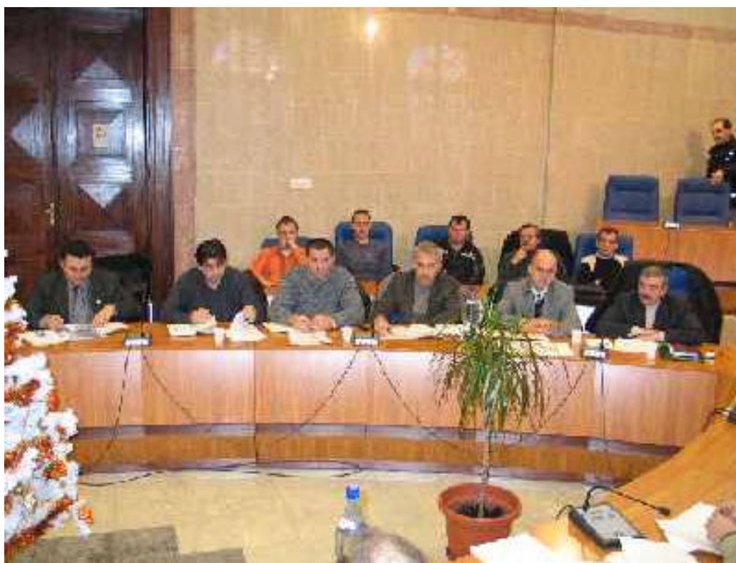
19.12.2006 – Discutii avute cu reprezentantii Camerei Taximetristilor – filiala Bacau